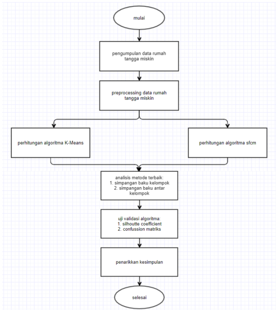
Gambar 1. Alur penelitian yang dilakukan